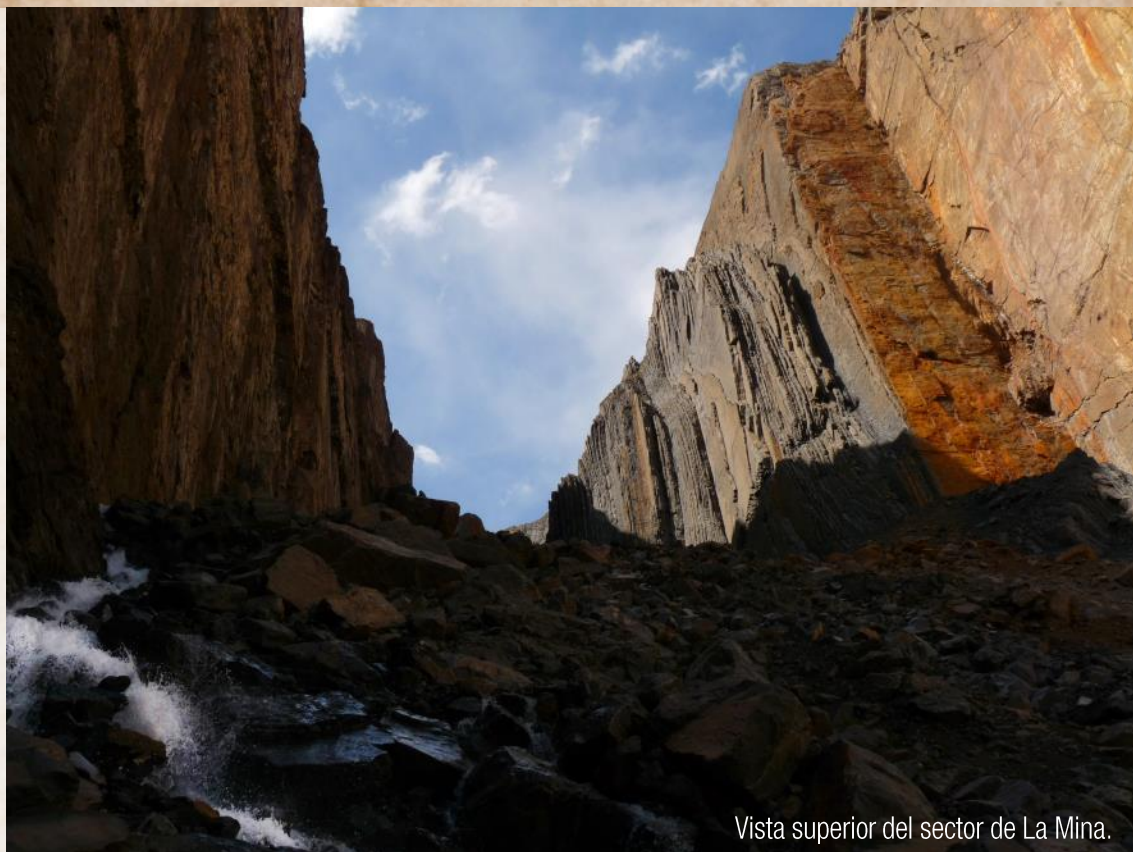
Vista superior del sector de La Mina.